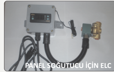
PANEL SOĞUTUCU İÇİN ELC